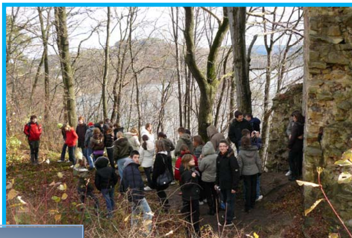
Pod ruinami zamku w

Jeziro Czchowskie zostało utworzone jako zbiornik wyrównawczy dla Jeziora Rożnowskiego. Dookoła jeziora lesiste wzniesienia pozwalają w trakcie wędrówek na podziwianie rozległych panoram widokowych. W Czchowie istnieją dwa kąpieliska, jedno położone nad jeziorem tuż obok przystani wodnej, drugie obok stadionu sportowego. Dodatkową atrakcją jest Splyw Doliną Dunajca. Przystań początkowa spływu mieści się w Czchowie - obok kąpieliska przy stadionie sportowym, natomiast przystań końcowa znajduje się w Zakliczynie. Przez cały czas oprócz pięknych widoków doliny Dunajca, czystej wody i mnóstwa ryb turystom towarzyszą na wzgórzach baszta czchowska i ruiny zamku w Melsztynie.